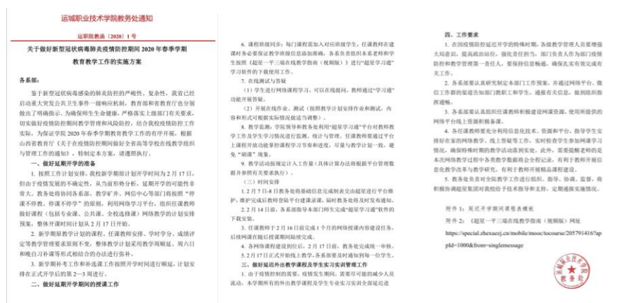
图 1：《关于做好新型冠状病毒肺炎疫情防控期间 2020 年春季学期教育教学工作的实施方案》

为落实省教育厅《关于在疫情防控期间做好全省高等学校在线教学组织与管理工作的通知》等相关文件精神，做好“停课不停教、不停学”工作，教务处于2020年2月7日制订并发布了《关于做好新型冠状病毒肺炎疫情防控期间2020年春季学期教育教学工作的实施方案》，并协同各系部、教学矿井、网信中心等部门积极调整教学计划，部署线上教学工作，确保“停课不停教、不停学”工作的落实。