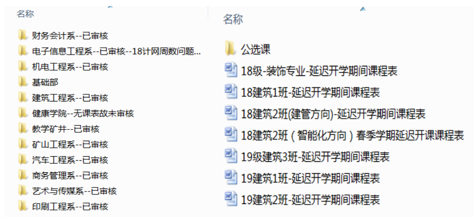
图 2：各系部调整之后的课程表

各系部在接到通知后认真落实、精心组织；广大教师也都能积极响应，做中学、学中做，加班加点建设网络教学资源，确保网络教学的顺利开展。